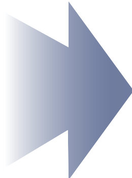
[자유로운 자산유형 선택 및 근거 제시]